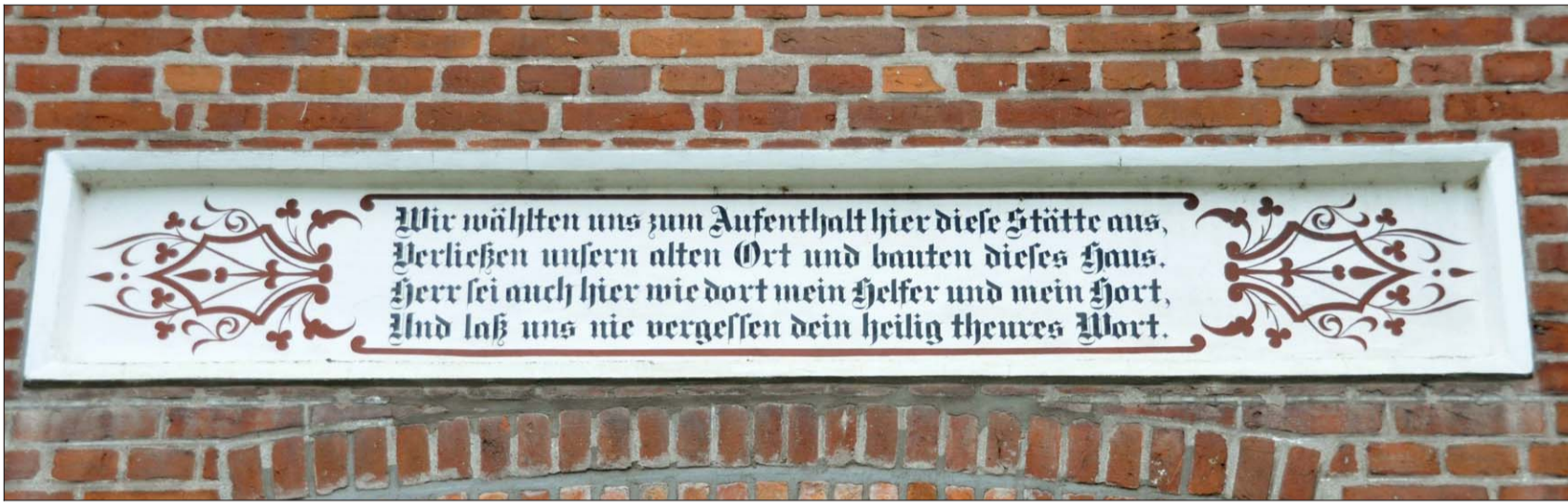
Für den Artikel über historische Hausinschriften ist Rolf Pohlmeier besonders in Groß Buchwald fündig gefunden. Wie auf dem Hof Hamann wurden in dem Dorf die Fronten mit Vierzeilern geschmückt.